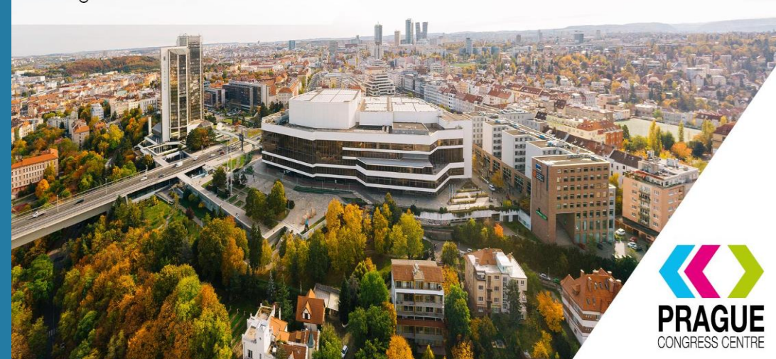
Kongresové centrum Praha